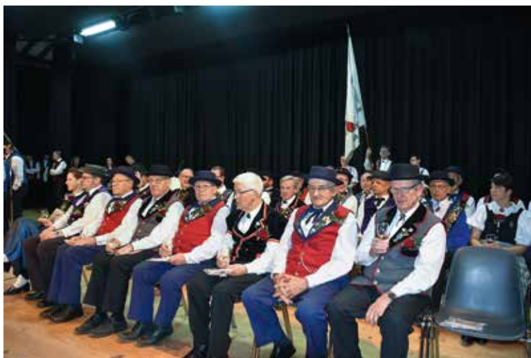
Am Abend findet die feierliche Ehrung von Gruppen, Ehrenveteranen und Veteranen statt.