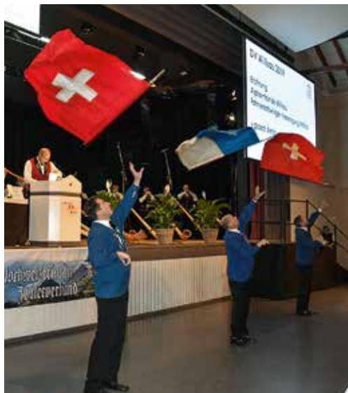
Sie eröffnen die Delegiertenversammlung, die Alphornfründe Willisau und die Fahnenschwinger Wilihof.