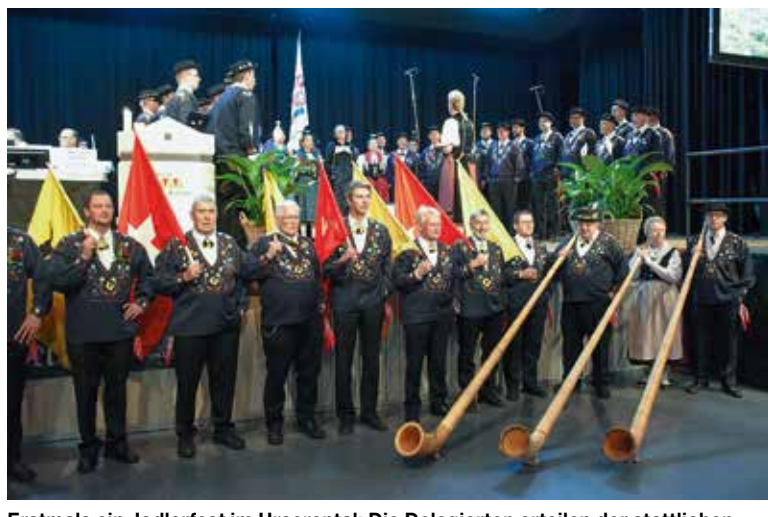
Erstmals ein Jodlerfest im Urserental: Die Delegierten erteilen der stattlichen Delegation aus dem Kanton Uri, den Jodlerklubs Bärgblüemli Schattdorf und Seerose Flüelen sowie der Alphornbläser- und Fahnenschwingervereinigung Kanton Uri den Zuspruch für das 64. Zentralschweizerische Jodlerfest 2021 in Andermatt.